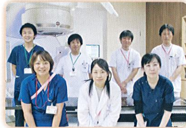
スタッフ集合写真

当院では、入院・診療棟の開棟に伴い、東海地区では第1号機となるエレクタ社製の放射線治療装置「VersaHD（バーサエイチディー）」を導入し、令和2年2月より放射線治療を再開いたしました。