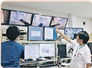
治療操作室及びスタッフ

これに加え、今後、より高精度な放射線治療である定位照射や、強度変調放射線治療も提供開始できるよう、現在準備を進めております。当地域でのがん治療の更なる発展に向けて、スタッフ一同、尽力に努めますので、引き続き放射線治療科へのご理解・ご支援のほどよろしくお願いいたします。