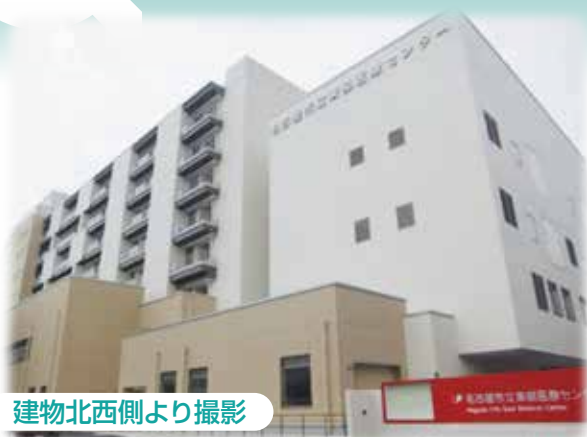
建物北西側より撮影