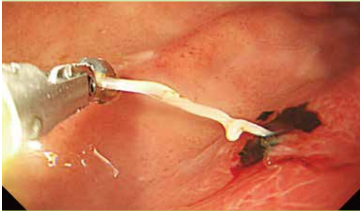
研修医の胃に住み着いたアニサキスの内視鏡的治療

マラリア、ジアルジア、サナダムシ。日本では稀な疾患ですが、当院の感染症科は一般の病院や大学病院でも診療が困難な輸入感染症や寄生虫症に対して、可能な限り対応しています。これまでに輸入感染症ではマラリア、デング熱、腸チフス、パラチフス、シャーガス病、無鉤条虫 むこうじょうちゅう など、国内の寄生虫疾患としては日本海裂頭条虫 にほんかいれつとうじょうちゅう 、肝蛭 かんてつ 、アメーバ、トキソカラなどの治療にあたってきました。これらの稀少疾患には保険適応のある検査法や治療薬が国内にないもの