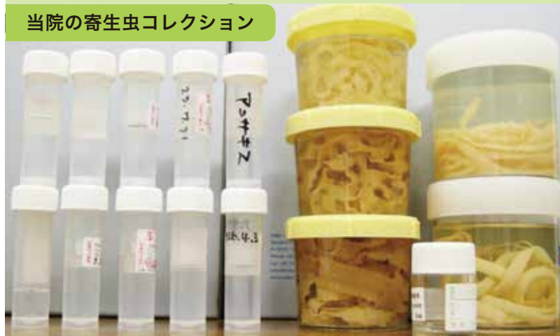
当院の寄生虫コレクション

が少なくありません。そのため安心して検査・治療が行えるよう、極めて厳しいと全国に評判の当院の臨床研究管理室と衝突（まれに協力）しながら診療体制を整えています。また、輸入感染症や寄生虫症は症例数が少なく診療経験のある施設が限られていますので、感染症関連の学会が運営するメーリングシステムを活用して、日本のどこかにいらっしゃる当該疾患を経験された先生方の意見を参考に診療を行うこともあります。感染症科のホームページにはアメーバとランプル鞭毛虫の可愛い動画が掲載されています。是非ご覧ください。