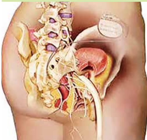
【図2】仙骨神経刺激療法