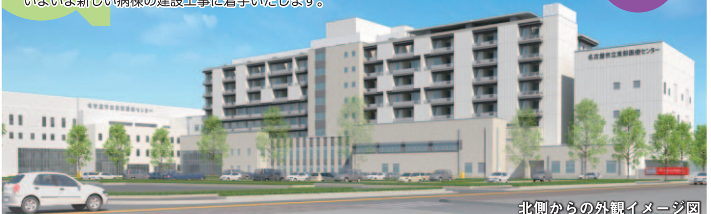
北側からの外観イメージ図