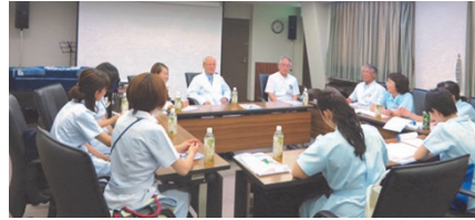
月一回の職員全員ミーティングの様子