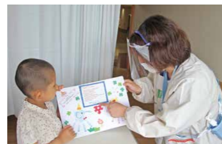
入院中のお子様と一緒に作業しています

また、プレイルームやベッドサイドでの遊びの提供や「30分保育」を行っており、子ども達と家族の不安やストレス