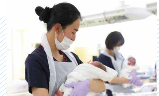
GCU（新生児回復治療室）