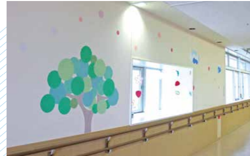
小児医療センター

また当院の小児科には、内分泌、アレルギー、新生児、神経、腎臓、循環器、血液・腫瘍、遺伝、児童精神など多彩な専門家が常勤しており、幅広い病気の治療を行っております。