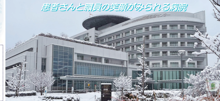
患者さんと職員の笑顔がみられる病院

《基本理念》 地域に根差した大学病院として、 高度かつ安心な医療を提供するとともに 優れた医療人を育成します。