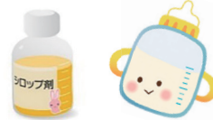
バニライチゴ味のシロップ

治療開始時に低血糖や低血圧などのリスクがあるため、1週間ほど入院をしていただきます。少量から開始し、検査結果、診察所見で問題なければ、数日ごとに増量します。