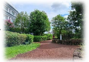
Hidamari no Oka (屋顶花园)