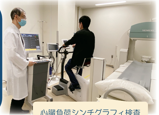
心臓負荷シンチグラフィ検査

当院ではあらゆる心血管領域の疾患に対応ができる体制を整えています。昨年新たに心筋シンチ用の運動負荷装置を導入しました(右写真)。心エコー、冠動脈CT、心臓カテーテル検査等とあわせて、患者様とよく相談し侵襲のかからない方法から診療を始めていきます。地域の連携を通して何よりも患者様と医療機関様に貢献できる迅速、安全、丁寧な対応を心がけており、ご紹介いただいた患者様は、病状が安定次第、必ず逆紹介させていただきます。