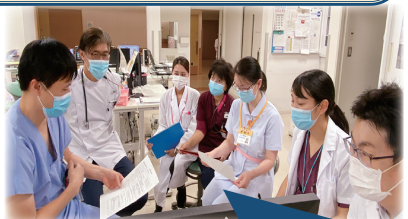
医師・看護師・理学療法士・薬剤師・管理栄養士・入退院支援職員等による循環器多職種カンファレンス(1回/週)