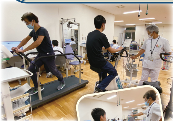
心臓リハビリ 風景

当院では入院された心不全患者さんに急性期から積極的に心臓リハビリテーションを行っています。心臓リハビリテーションとは、心臓病の患者さんが体力を回復し、自信をもって快適な家庭生活や社会生活に復帰するとともに、心不全の再発を防止することをめざして行う活動プログラムのことです。運動療法に加え、食事指導や禁煙指導など生活指導も行います。専門知識を持った医師、看護師、理学療法士、薬剤師、管理栄養士など多くの専門医療職がかかわって、患者さんひとりひとりの状態に応じた効果的なリハビリプログラムを実施します。