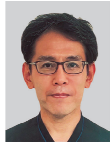
副病院長・脊椎センター長 整形外科部長・ リハビリテーション科部長 教授（診療担当）