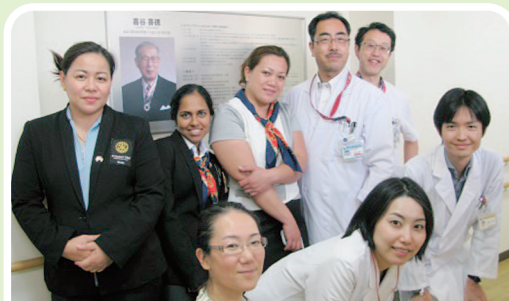
当院の喜谷記念がん治療センターで