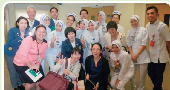
訪問先のクイーン・エリザベス病院で

マレーシアへ帰国された後には今回の研修の経験を活かして、日本流の感染管理の考え方を取り入れた活動を実践しているとのことをご報告をいただきました。