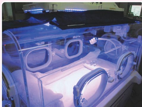
ご寄附で整備した光線療法器

ご寄附をお考えの方は、病院事務課さくら基金担当(052-858-7113)までご連絡ください。