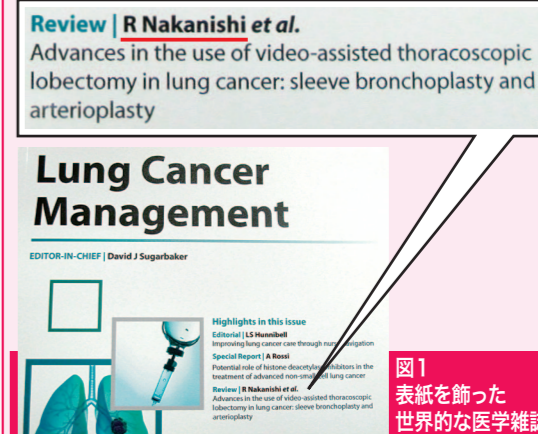
図1 表紙を飾った世界的な医学雑誌

今後も早期だけでなく進行肺がんに対する胸腔鏡手術をさらに極める所存ですので、治療をご希望の際には、是非当科をご受診ください。