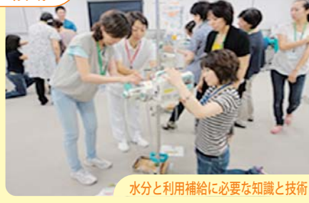
水分と利用補給に必要な知識と技術

研修は大きく3つの領域に分けて実施しており、【領域1】は医療技術の修得を目標とする領域、【領域2】はコミュニケーションや臨床心理、介護・看護技術修得を目標とする領域、【領域3】は薬物療法や臨床研究の知識や技術修得を目標とする領域ですが、臨床シミュレーションセンターでは領域1と2の研修を年間12回ほど実施しています。普段接することの少ない薬局薬剤師と医学部、看護学部、大学病院等のスタッフとの気軽な交流も本研修の大きな魅力となっており、それ自体がすでにチーム医療を推進しているとも言えます。そんな講師の方々の熱心な指導に受講した薬剤師からも高い評価をいただいています。お忙しい中で協力いただいている