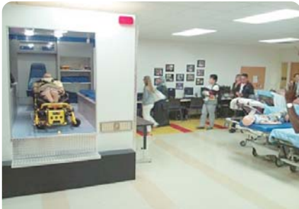
救急車内シミュレーションセット

本年1月に米国のフロリダにおいて開催された医療シミュレーション国際学会に参加し、その際に現地の2つのシミュレーションセンターを見学する機会がありました(下図)。医師・看護師はもとより、特に呼吸療法士、検査技師、救急救命士などのパラメディカルの方々の、シミュレーション教育の充実には目を見張るものがあり、その設備と規模に圧倒されました。わが国でも当センター設立の元になっている全国で展開されている地域医療再生計画により全国各地でシミュレーションセンターが設立されていますが、運用面も含めて、まだまだ大きな差があると実感しました。