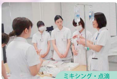
ミキシング・点滴