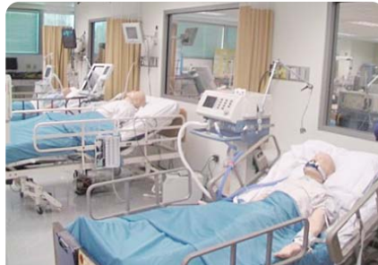
呼吸療法士養成センター