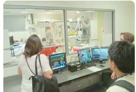
心臓検査スペシャリスト養成センター

今号でもご紹介いただいた、各種のシミュレーション教育は、開催する方々と参加する方々の両方の情熱があって初めて成り立っています。関係者の情熱に敬意を表したいと思います。今後も、利用者の方々が利用しやすくなる運営方法などを工夫することで、地域および学内の医療安全やチーム医療の向上につなげる努力をしていきたいと考えています。