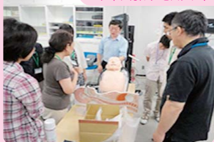
医療従事者のための救急救命トレーニング