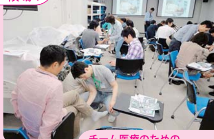
チーム医療のための フィジカルアセスメント