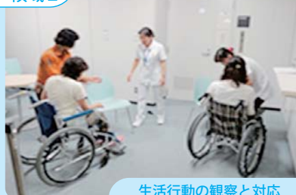
生活行動の観察と対応