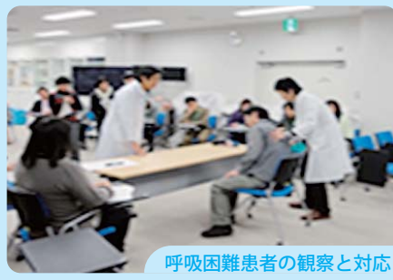
呼吸困難患者の観察と対応