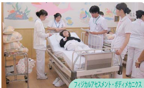
フィジカルアセスメント・ボディメカニクス

技術研修をする場合は演習に入る前に、正しい知識の確認が必要となります。臨床シミュレーションセンターでは、多目的室の半分を講義スペース、半分を演習スペースとして利用し、知識の習得・デモンストレーション・演習という順に研修を進めることができました。