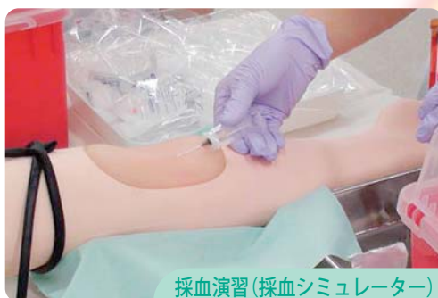
採血演習(採血シミュレーター)